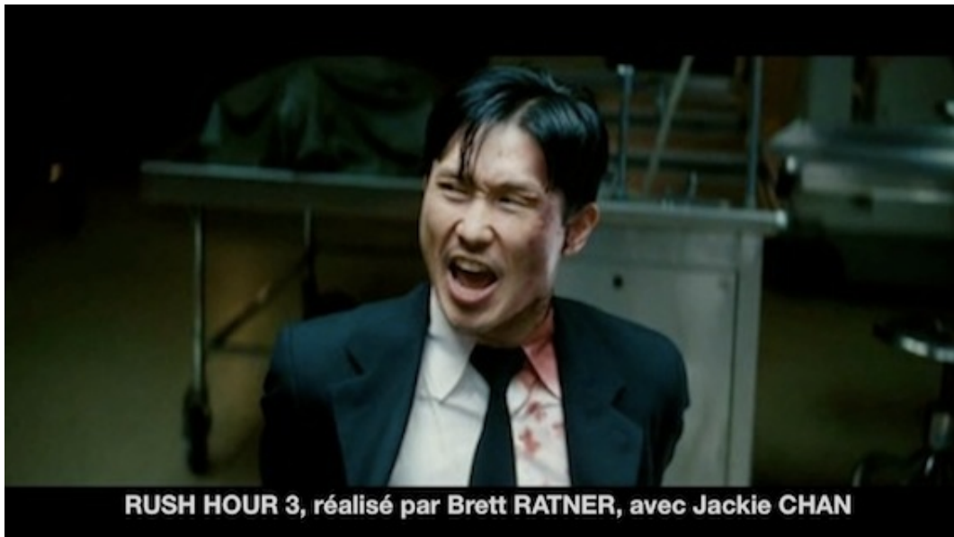
RUSH HOUR 3, réalisé par Brett RATNER, avec Jackie CHAN