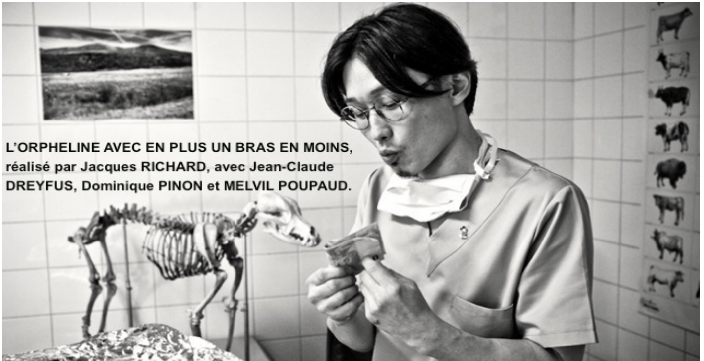
L'ORPHELINE AVEC EN PLUS UN BRAS EN MOINS, réalisé par Jacques RICHARD, avec Jean-Claude DREYFUS, Dominique PINON et MELVIL POUPAUD.