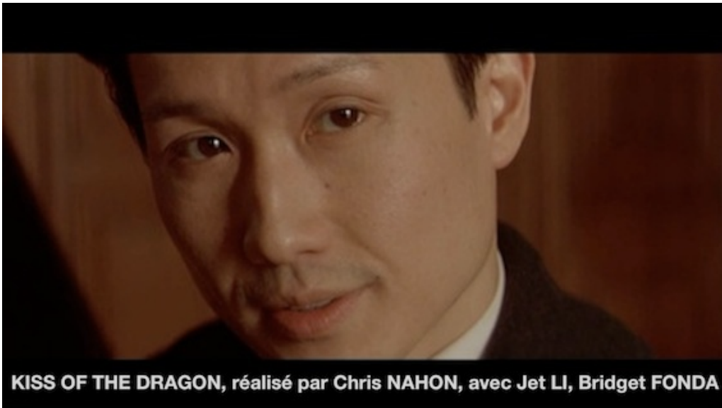
KISS OF THE DRAGON , réalisé par Chris NAHON, avec Jet LI, Bridget FONDA